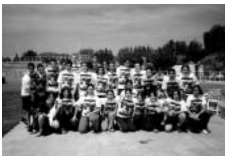
Classe guanyadora de 2n d'E.S.O

En conseqüència, aquesta és l'activitat del curs més participativa i integradora de l'Escola: hi som els alumnes, els monitors, i els professors.