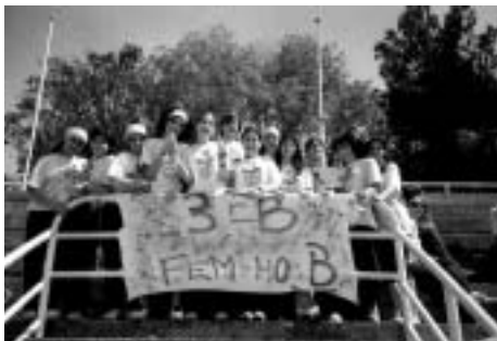
Classe guanyadora de 3r d'E.S.O

Tot plegat, l'esport també pot ser una activitat lúdica, una gran festa.