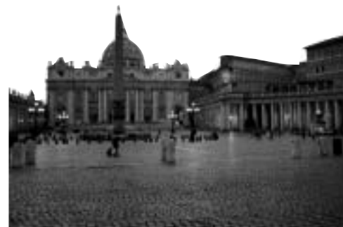
Plaça de Sant Pere.

És molt difícil poder explicar amb paraules, el que va ser l'últim viatge de la gent de 2on de batxillerat dins el marc de l'escola. El fet que fos el darrer, significava en primer lloc, que el destí havia de ser un lloc especial, i com que només vam poder elegir entre París i Itàlia, ens vam decantar per "la bota" del Mediterrani. Ens va semblar que les visites a Pisa, Roma, Vaticà, Florència i Venècia, eren els millors llocs per passar junts el nostre últim exili, com a estudiants del Joan Pelegrí.