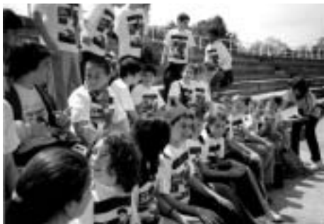
Classe guanyadora de 1r d'E.S.O

Un any més, hem celebrat la diada esportiva de l'Escola. Tots els alumnes de l'E.S.O. i 1r de batxillerat han participat en les diferents activitats organitzades per nivells: