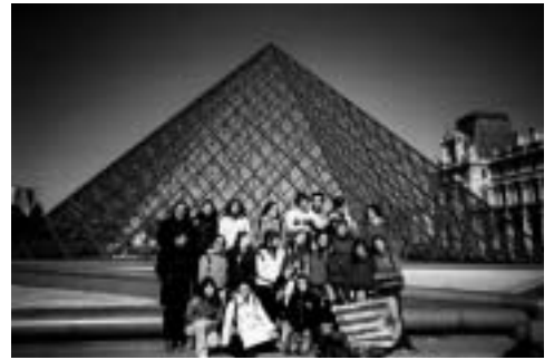
El grup davant la piràmide d'accés al Louvre, París.

Durant els dies del 15 al 21 de març, un grup de nois i noies francesos de l'institut Rey de Rouen van ser acollits per estudiants de francès de 4rt d'ESO i batxillerat.